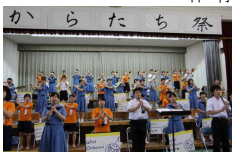
文化祭「からたち祭」