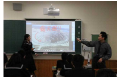
タブレット・電子黒板を使った授業