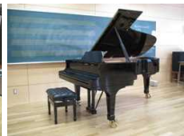
スタインウェイ・ピアノ