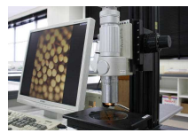
デジタルマイクロスコープ